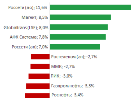
Лидеры роста и падения за неделю 14-18 января